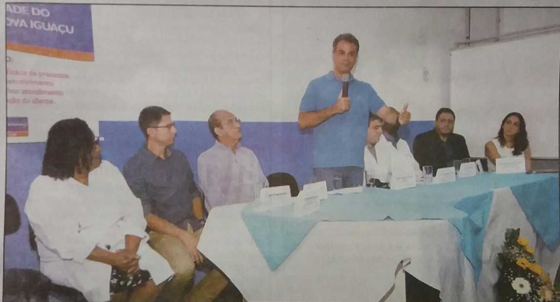
Para o prefeito Rogério Lisboa, a implantação do setor representa uma nova etapa, a busca por qualificação do serviço

FOI IMPLANTANDO NA UNIDADE UM COMITÊ DE QUALIDADE IRÁ PROMOVER MELHORIAS CONTÍNUAS, BUSCAR EFICÁCIA NOS PROCESSOS DE ATENDIMENTO E ESTABELEÇER POLÍTICAS DE DESENVOLVIMENTO ORGANIZACIONAL PARA OBTER MELHOR SUPORTE AO USUÁRIO