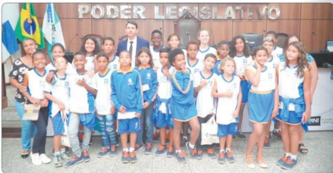
Juntos e misturados: Legislativo e Escola

“Ano que vem irei ser o porta-voz da Baixada Fluminense na Câmara dos Deputados, e aproveito este momento para agradecer o apoio de todos que me conduziram até lá.