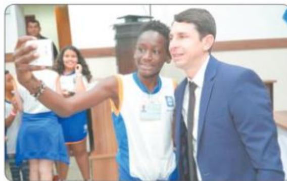
Presidente Juninho no momento selfie com a garotada