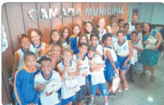
"Dá licença que estou entrando em casa"