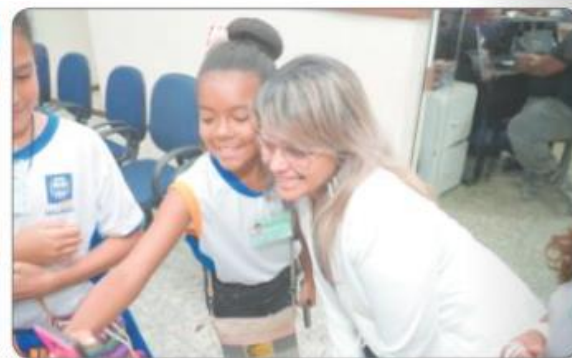
Pose pra foto